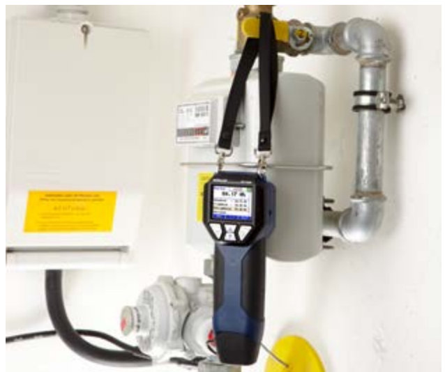
Drukregelaars zijn eenvoudig te controleren.