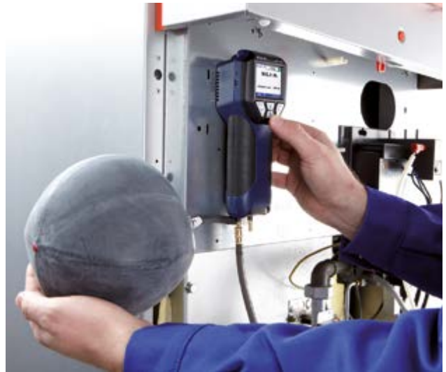
Testen met gas met behulp van de optionele gasballon.