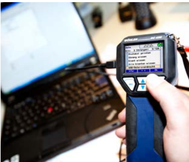
Gegevensoverdracht naar PC via USB.