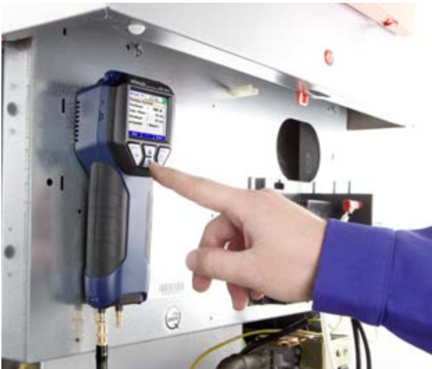
Flexibele bevestiging dankzij magneten in de behuizing.