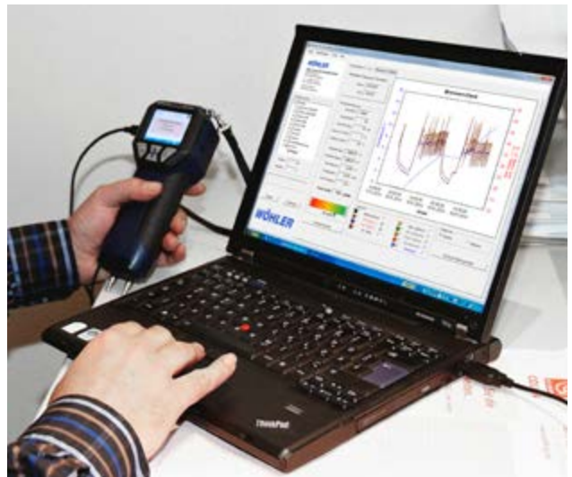
Wöhler DC-serie PC-software voor de evaluatie van meetresultaten.