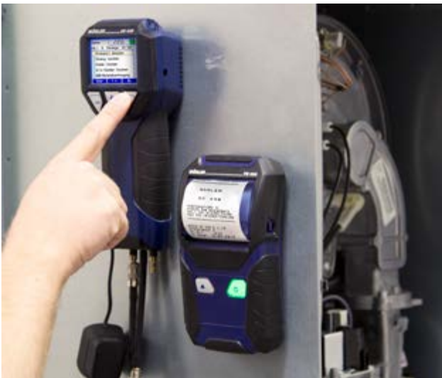
Meetprotocol via IR-poort naar een IR-printer.