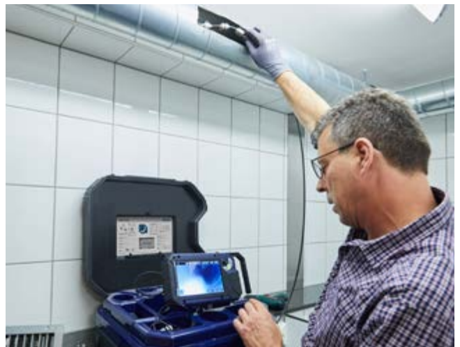
De inspectie van ventilatiesystemen is dankzij de 30 m duwstang geen probleem.