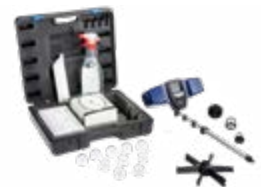
Locator/ geleidingssysteem 100 Wöhler camerakop ø 40 mm