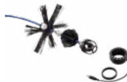
Belichtings-/ geleidingssysteem 100 Wöhler camerakop ø 40 mm