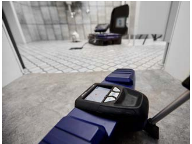
Met de Wöhler L 200 locator is de camerakop exact te localiseren.