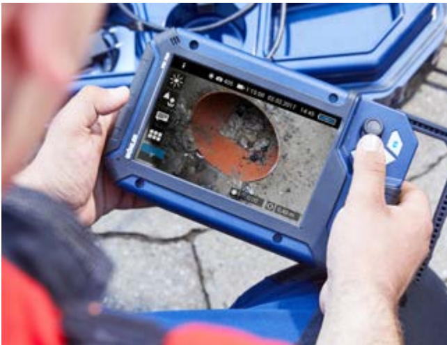
Superscherp beeld, gebruiksvriendelijke menustructuur en comfortabel in de hand.