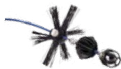
Geleidingssysteem 100 Wöhler camerakop ø 40 mm

Hier vindt u de meest gewilde toebehoren van klanten