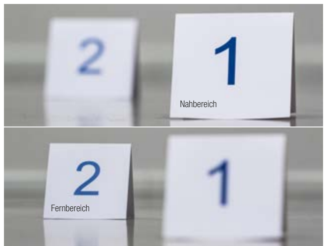
Mechanische focusregeling voor optimale beeldkwaliteit.