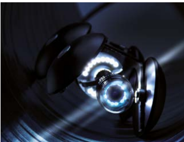
De inspectie van grote ventilatiesystemen is dankzij de 30 m duwstang en de camerawagen geen probleem.