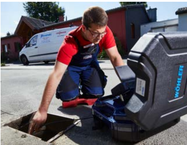
Betrouwbare rioolinspectie dankzij de waterdichte camerakop. De zonneklep zorgt voor goed beeld tijdens zonnige weersomstandigheden.